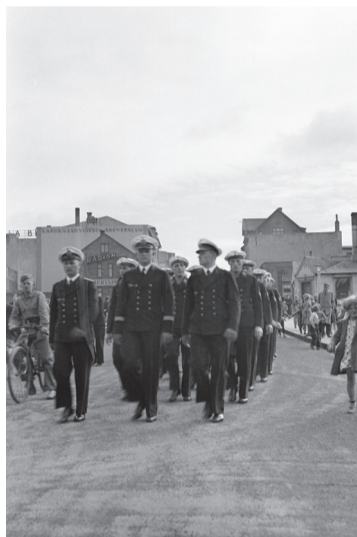
Sjólíðar af þýska herskipinu Emden ganga niður Bankastræti í ágúst 1938.