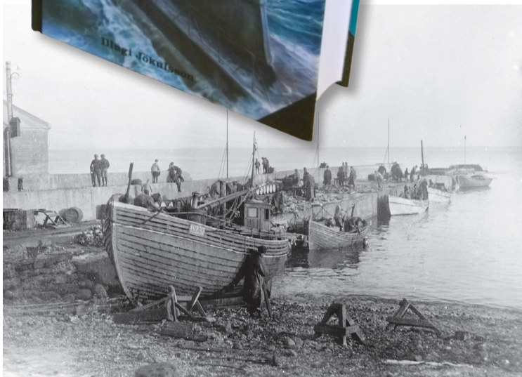
Ys og þys við höfnina í Bolungarvík einhverntíma fyrir miðja 20. öld.