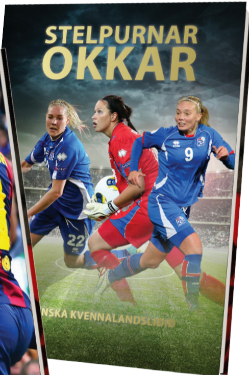
Íslenska kvennalandsliðið í fótbolta hefur náð frábærum árangri.