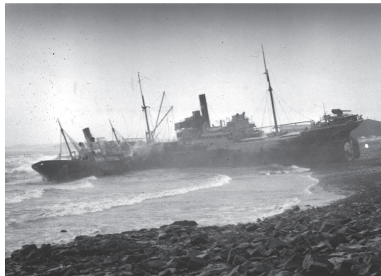
Portúgalska flutningaskipið Ourem og danska skipið Sonja Mærsk á strandstað í Rauðarárvík.